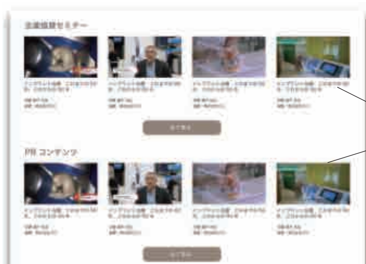
貴社のセミナー動画配信ページ