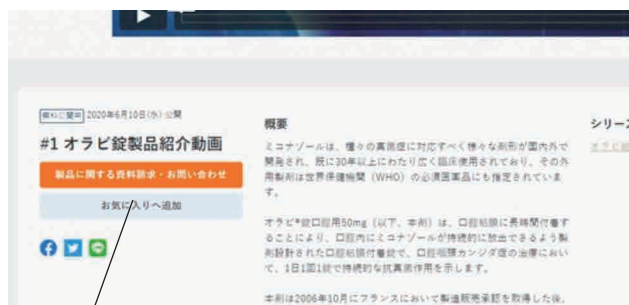
資料請求・お問い合わせボタン